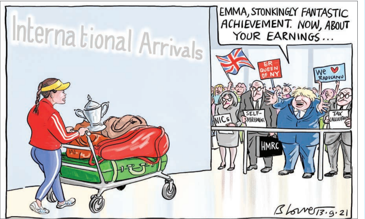
قهرمان ۱۸ ساله تنیس اوپن آمریکا به وطنش یعنی بریتانیا برگشته و بورس جانسون که این روزها طرحی برای تامین اجتماعی دارد، بعد از یک تیریک مختصر و تعریف و تحسین از او، می‌گوید: «او ما در مورد (مالیات) جایزه‌ات...!»

اقتصاد تاجیکستان اقتصادی پویا به حساب می‌آید و در میان کشورهای آسیای میانه مهم تلقی می‌شود. اما نامی توان تاجیکستان را قدرتی اقتصادی نامید. این کشور یک وارد کننده عمده انرژی است. درصد زیادی از جمعیت به کشاورزی مشغولند و خدمات در مرتبه دوم و میزان صنعتی بودن کشور بسیار پایین است. جمعیت تاجیکستان در سال ۲۰۲۰ میلادی ۶۶۹/۸۷۲/۸ تن برآورد شده است که از این تعداد نزدیک به ۳۸/۴ درصد تاجیک و ۸/۱۲ درصد ازبک‌اند. قرقیزها، ترکمن‌ها، تاتارها، عرب‌ها و روس‌ها هم رفته‌رفته نزدیک به دو درصد جمعیت را تشکیل می‌دهند. تاجیک‌ها به فارسی تاجیکی سخن می‌گویند. دو زبان فارسی و ازبکی در تاجیکستان به گستردگی سخن‌رانده می‌شوند که فارسی تاجیکی از شاخه زبان‌های ترکی است. نود و هشت درصد جمعیت مسلمانند. از میان آنها ۹۵ درصد سنی حنفی و باقی شیعه اسماعیلی هستند. تاریخ و فرهنگ تاجیکستان با ایران اشتراکات بسیاری دارد. در پاره‌هایی از دوران پیش از اسلام، تاجیکستان زنده‌کننده فرهنگ ایرانی و به وجود آورنده زبان پارسی دری بود که جانشین زبان پهلوی گشت. نخستین شاعران پارسی‌زبان از این ناحیه به پا خاستند، مانند رودکی، که پدر شعر پارسی است. حکومت ساسانی نیز از تاجیکستان برخاسته است. در سال‌های اخیر روابط چندان پررنگ نبوده است اما از نظر فرهنگی دلبستگی‌ها پابرجاست. یکی از نقاط عجیب در مورد تاجیکستان جنگ سرد اعلام نشده‌اش از زبکستان است. این دو در آسیای میانه بدترین روابط دو جانبه دارند. اختلاف دو کشور با یکدیگر به دهه بیست میلادی برمی‌گردد. اما حالا برای این روابط شرکاب هم چاره‌هایی اندیشیده شده. با انتخاب شوکت