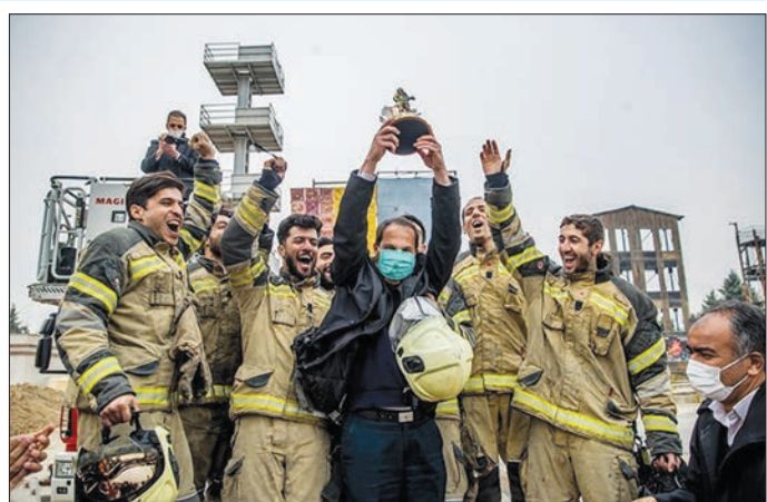
قابی از اولین دوره رقابت های مهارتی - عملیاتی آتش نشانان تهران.