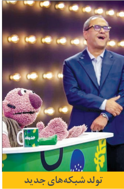
تولد شبکه‌های جدید

چه نتیجه‌ای به دست آمد غالب سریال‌هایی که در چند فصل ساخته شدند، موفق بوده‌اند. الگوی پایتخت فعلاً جواب داده و به نظر می‌رسد تداوم خواهد داشت.