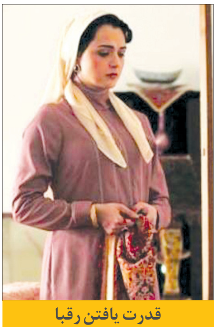
قدرت یافتن رقبا

چه نتیجه‌ای به دست آمد سلمان فارسی یکی از امیدهای تلویزیون محسوب می‌شود که میرباقری همچنان مشغول ساخت آن است و طبق اعلام سال ۱۴۰۵ روی آنتن خواهد رفت. علیخانی عصر جدید را راه‌انداخت که برنامه‌ای پر بیننده است. رشیدپور با حالا خوشبخت موفق بود، اما برای برنامه‌های دیگرش اتفاقی که باید رخ نداد. بازگشت مدیری منجر به در حاشیه و برنامه محبوب دورهمی شد.