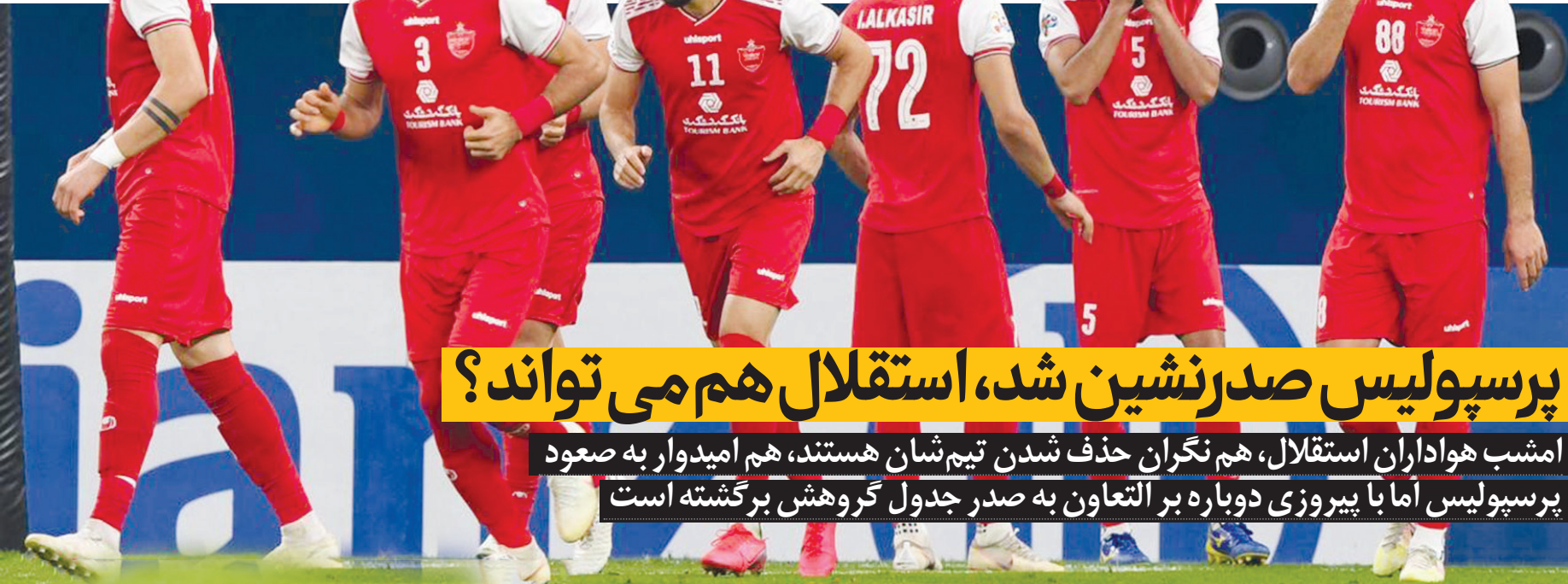
آروزنامه صبح ایران آگس ۲۰۰۸