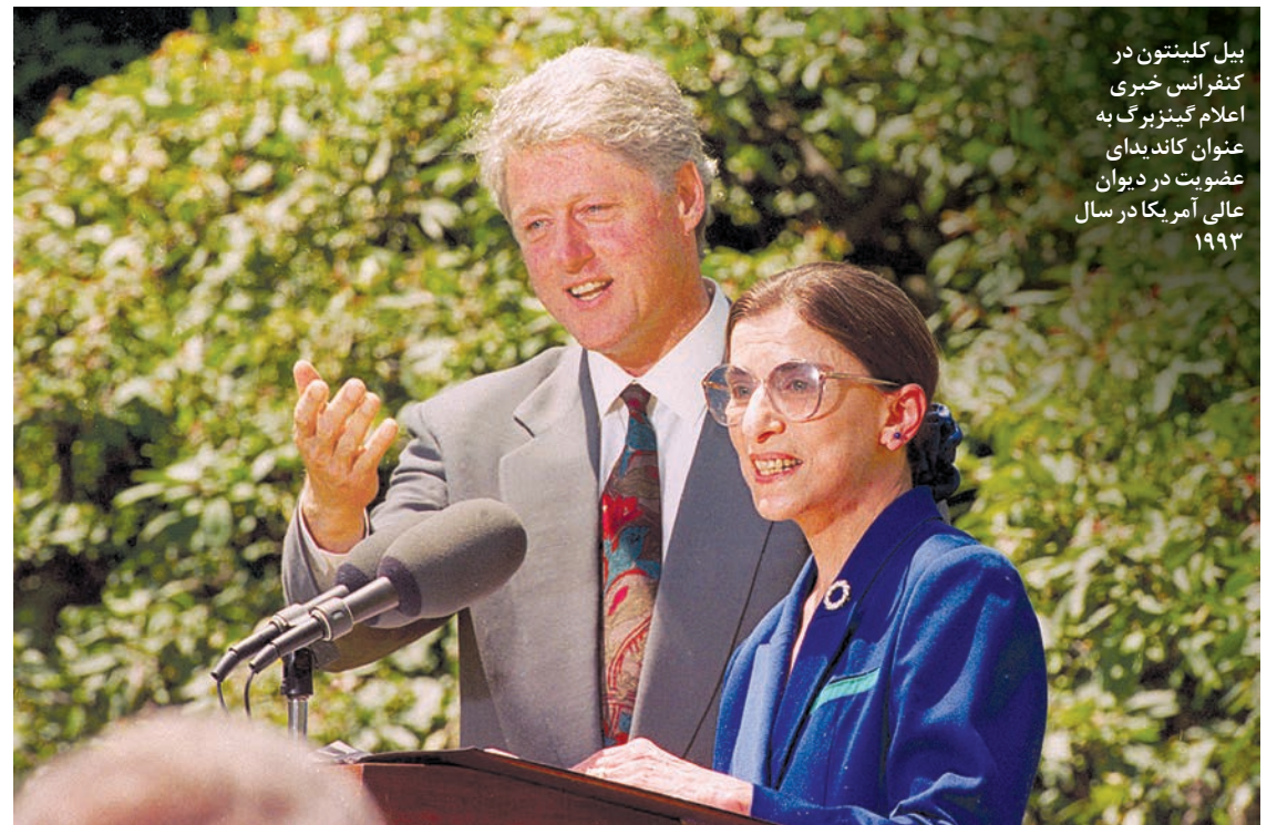
بیل کلینتون در کنفرانس خبری اعلام گینزبرگ به عنوان کاندیدای عضویت در دیوان عالی آمریکا در سال ۱۹۹۳

۱ مرگ مشهورترین قاضی آمریکا کشور را در بهت فرو برد. هرچند روث بیدر گینزبرگ مدت‌ها بود که از بیماری سرطان رنج می‌برد اما همانطور که او خودش هم آرزویش را داشت، دموکرات‌ها مایل بودند که این واقعه تا بعد از انتخابات ۲۰۲۰ به تعویق بیفتد. گینزبرگ گفته بود که آرزو دارد رفتن ترامپ از کاخ سفید را پیش از مرگش ببیند.