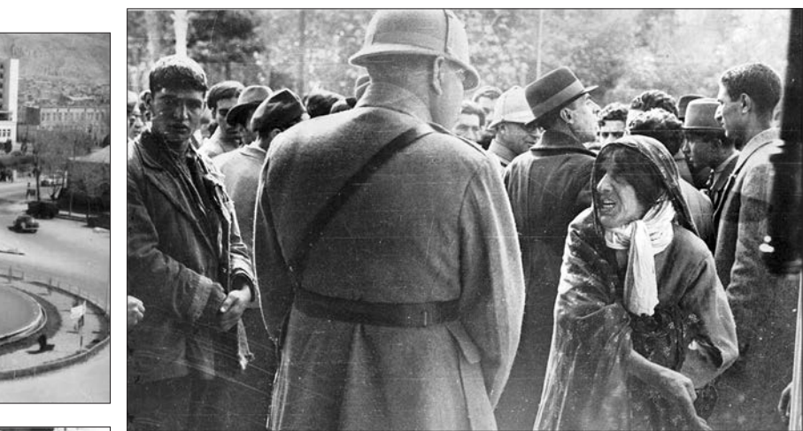
قاب تاریخ ۱ تصویری از تظاهرات مردم در روز ۱۷ آذر ۱۳۲۱ در ماجرای بلوای نان