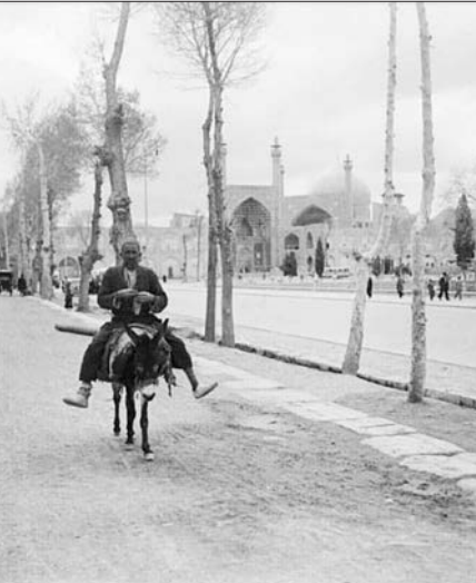
قاب نوستالژی ۲