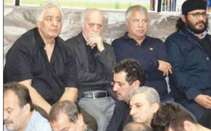
عکسی از علی پروین در مراسم وداع با محرم در کنار محمدرضا طالقانی و محمود خوردبین.