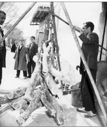
قاب نوستالژی ۲ هیزم فروشی در دهه ۴۰

قاب مشاهیر فوتبالیست‌های بسکتبالیست سال ۱۳۵۴: علیرضا عزیزی، مانیس میناسیان، محمود اعتمادی، ناصر حجازی، بهرام مودت، حسین کازرانی - ایرج دانایی‌فرد، حسن روشن، غلامحسین مظلومی، اسماعیل حاج رحیمی‌پور، علی پروین. در مسابقه دوستانه بسکتبال بین تیم ملی فوتبال و تیم ملی بسکتبال ایران (فدراسیون تاریخ و آمار فوتبال ایران)