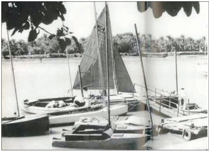
قاب نوستالژی ۱ باشگاه قایقرانی شرکت نفت آبادان معروف به بوت کلاب، نخستین باشگاه قایقرانی ایران در سال ۱۳۳۰

قاب تاریخ ۱ ژاک شیراک در دی ماه ۱۳۵۳ به عنوان نخست وزیر فرانسه به ایران سفر کرد. این عکس را ژان سرو در تالار سلام کاخ گلستان از بازدید شیراک در این مجموعه انداخته است. (از صفحه علیرضا محمودی)