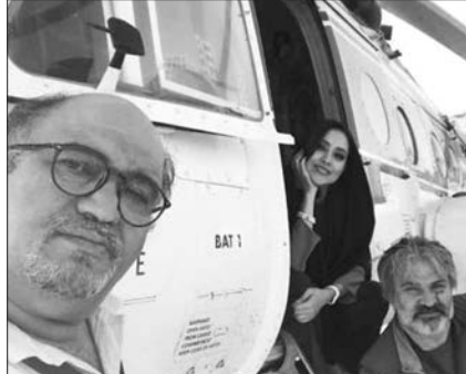
سلفی نادر سلیمانی با بهاره کیان‌افشار و مهدی سلطانی در کنار هلی‌کوپتر در پشت صحنه فیلم مرد نقره‌ای.