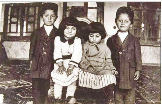
قاب تاریخ ۲ عکس یادگاری کودکان در سال ۱۳۰۵