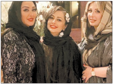
عکسی از شب‌نشینی الهام حمیدی با نیوشا ضیغمی و نفیسه روشن در اینستاگرامش.