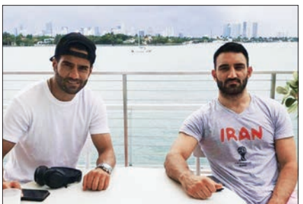
در روزهایی که دنیزی منتظر تکمیل بازیکنانش در تمرین تراکتورسازی است، مسعود شجاعی ظاهرا در دویی پست گذاشته.